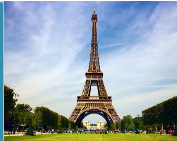
法國艾菲爾鐵塔 Eiffel Tower, Paris, France