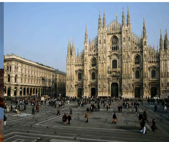
義大利米蘭 Milan, Italy