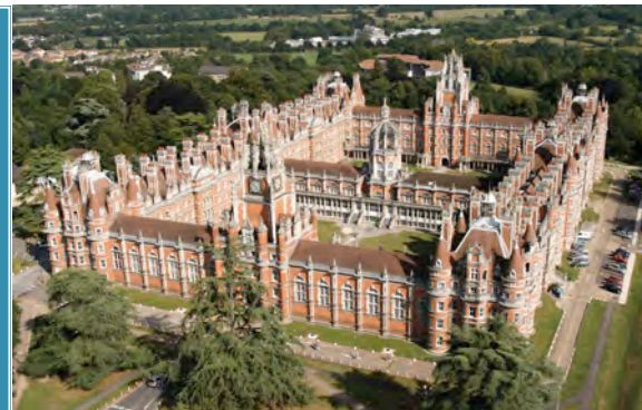
皇家哈洛威大學 Royal Holloway University