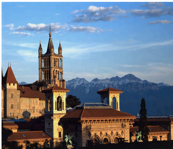
瑞士洛桑 Lausanne, Switzerland