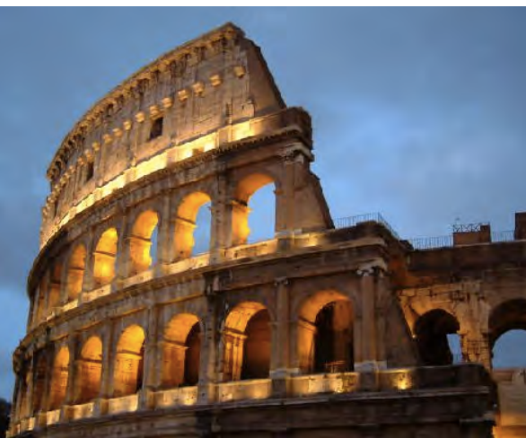
義大利羅馬 Rome, Italy